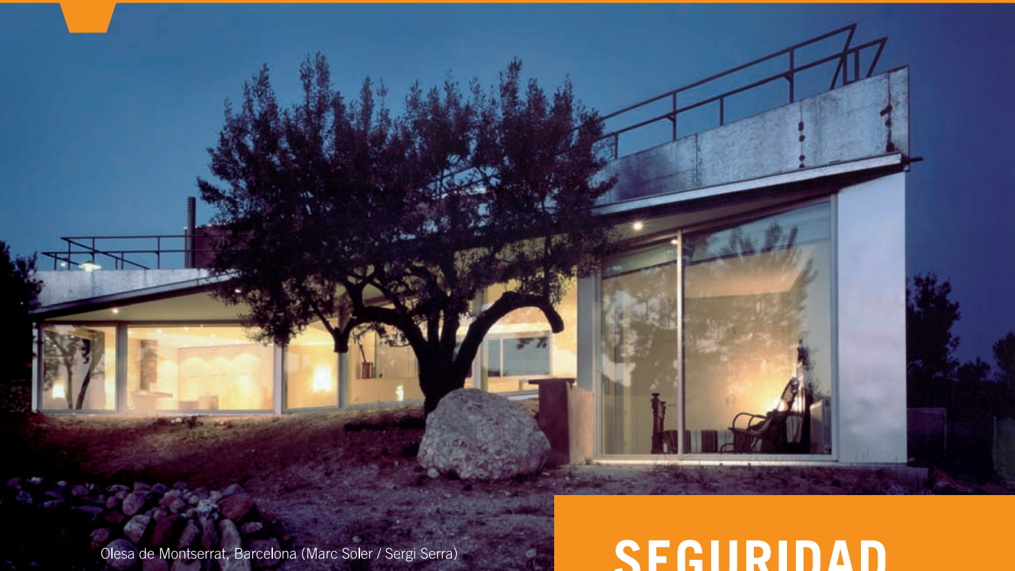
Olesa de Montserrat, Barcelona (Marc Soler / Sergi Serra)