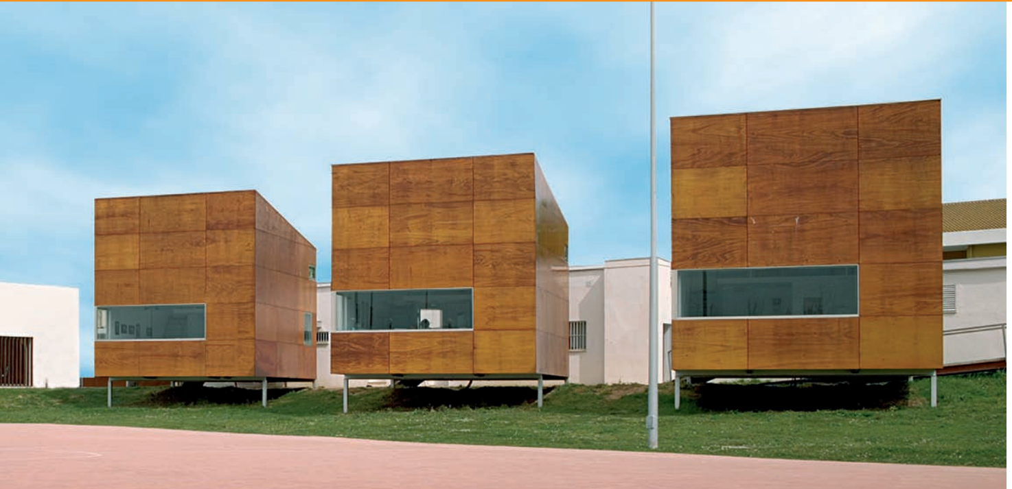
La Línea de la Concepción, Cádiz (Fernando Alda)